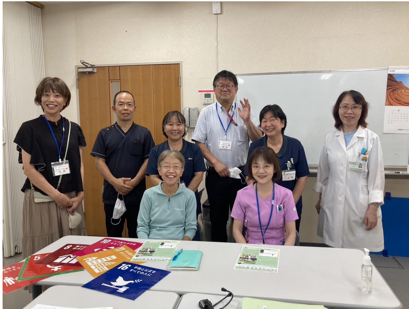
Our HPH committee